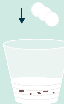
כסו עם צמר גפן נוסף